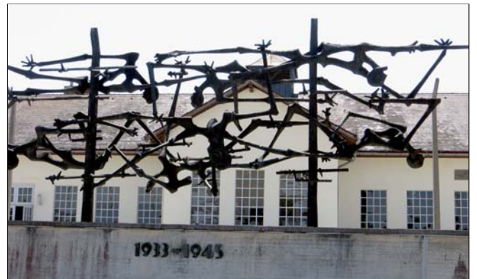
Internationales Mahnmahl – es wurde 1968 auf dem ehemaligen Appellplatz errichtet.