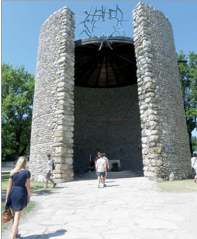
Todesangst-Christi-Kapelle – sie ist geistlicher Ort der Erinnerung, der Mahnung und des Gedenkens auf dem Gelände des ehemaligen Konzentrationslagers.