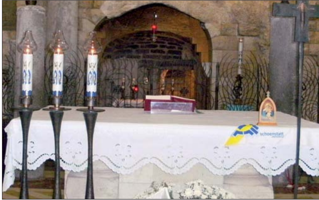
Heilige Messe in der Verkündigungsgrotte.